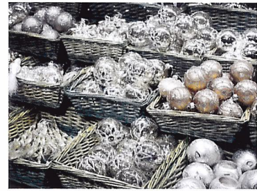
Afb. 2.54 Kleur benadrukt de sfeer van een thema. De oudroze tinten gecombineerd met naturel geven een natuurlijke kerstsfeer.

2.21 Wat is de invloed van kleur in een presentatie op de langlopende klant?