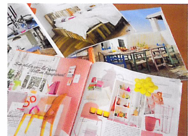
Afb. 2.60 Een sfeercollage maak je door uit allerlei tijdschriften plaatjes te halen.