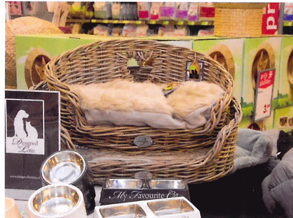
Afb. 2.47 Met een productpresentatie op een afdeling creëer je sfeer en trek je de aandacht van mensen naar nieuwe trends of producten.

Elk seizoen is anders in een winkel die groene producten verkoopt. Bij elk seizoen horen andere producten. Hierdoor verander je in een winkel steeds de inrichting en de presentaties in schappen en op displays. Het maken van een etalage of een presentatie start met het bedenken van een thema.