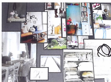
Afb. 2.58 Een sfeercollage van de trend 'ruw hout'. Deze collage kun je gebruiken voor de interieurafdeling van een tuincentrum.

Als je bijvoorbeeld een nieuw soort buitenbeits voor tuinhout gaat presenteren, zoek je plaatjes van tuinhekken in een tuin, kwasten en buitenmaterialen van hout in de kleuren groen en bruin. En plaatjes van een boomstam, vogelhuisjes of een houten plantenbak met beplanting.