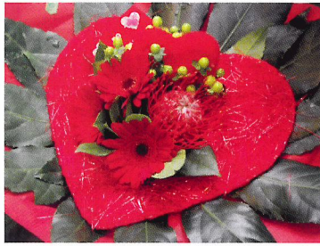
Afb. 2.53 De kleur rood in past bij het thema Valentijnsdag.