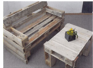
Afb. 2.51 Van pallets tuinmeubels maken kan een trend zijn.