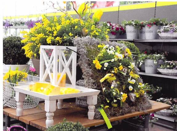
Afb. 2.48 In een tuincentrum kun je de seizoenen heel goed als thema gebruiken.