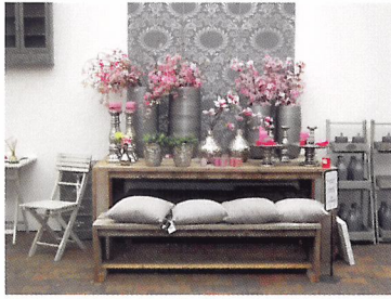
Afb. 2.52 De roze kleur in deze presentatie trekt de aandacht van de klant.