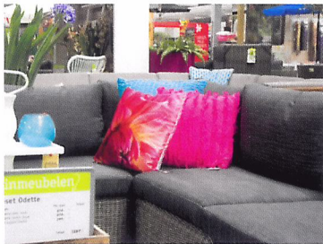
Afb. 2.49 De trend 'felle kleuren in de tuin'

Trends zijn ontwikkelingen in een bepaalde richting, bijvoorbeeld op het gebied van mode, muziek, techniek of producten. Denk maar aan de nieuwe zomer- en wintermode. Je ziet nieuwe kleuren en nieuwe modellen. Je ziet dus de nieuwste trends. Ook in winkels die groene producten verkopen zijn er trends. Je kunt elk seizoen nieuwe spullen inkopen en presenteren en je daarbij laten beïnvloeden door de nieuwste trends. De klanten zien dan goed wat 'in' is en willen vaak deze spullen ook thuis hebben. Als de trend is 'gezond eten', kun je in een tuincentrum allerlei groentes, fruitbomen en producten verkopen die mensen in hun achtertuin zelf kunnen telen. En is de trend 'biologisch eten', dan kun je in een boerderijwinkel bijvoorbeeld biologische kaas verkopen.