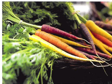
Afb. 2.50 Er worden steeds nieuwe wortels ontwikkeld.