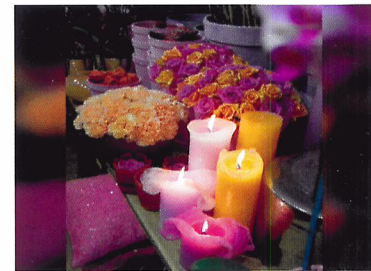
Afb. 2.57 Gebruik maximaal één à twee kleuren in een presentatie. Dit geeft rust en maakt een presentatie sterker.