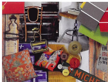
Afb. 2.59 Een sfeercollage met de kleuren oranje en bruin.